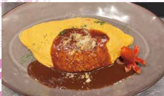
写真は薄巻きデミグラス